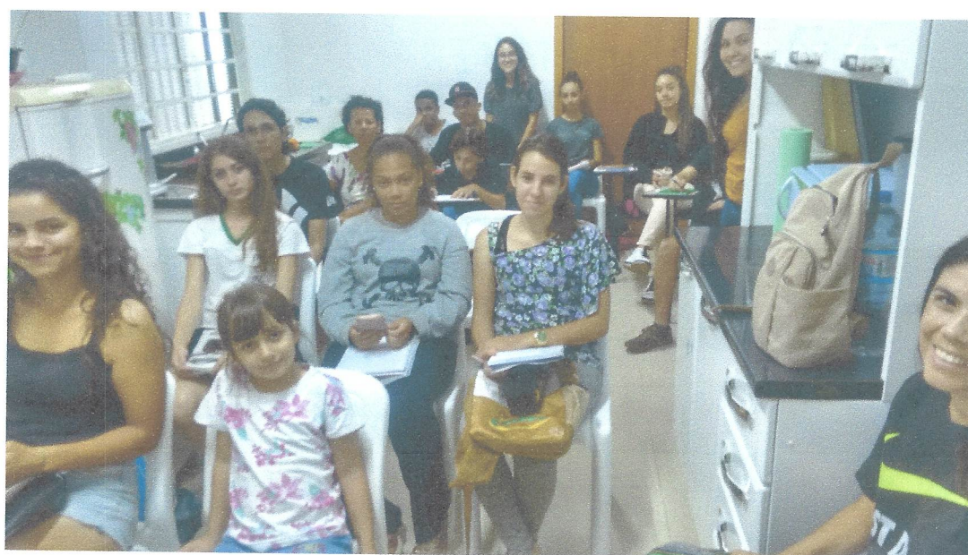
Oficina de Espanhol e Inglês