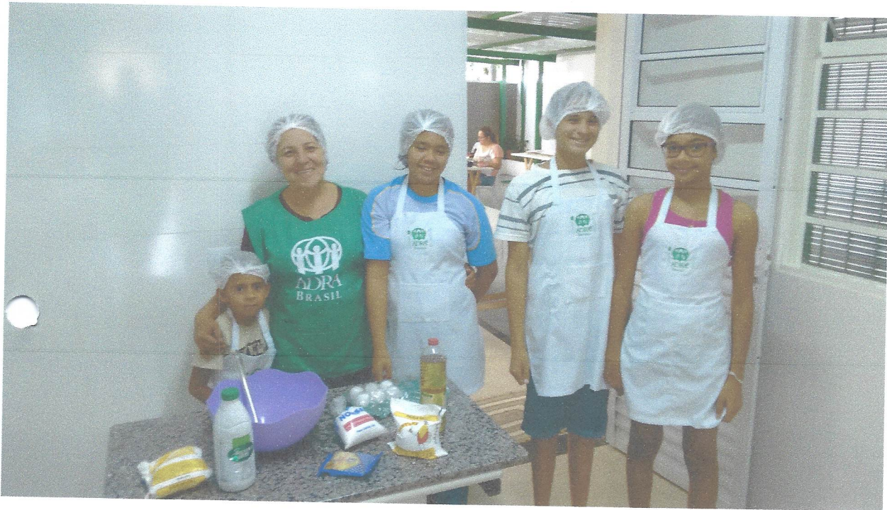
Oficina Culinária mirim

Rua Prof. a Magdalena Sanseverino Grosso, 850 – Jd. Rezek II - Artur Nogueira - SP - CEP 13160-144 CNPJ 15.355.260/0001-57 Fone/Fax (19) 3877-9025 E-mail: susana.machuca@ucb.org.br Site: http://adra.org.br/transparencia/