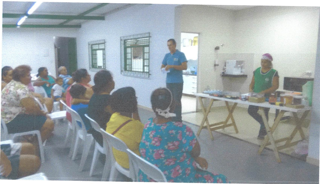
Aula de Empreendedorismo e Workshop Ovos de Pascoa