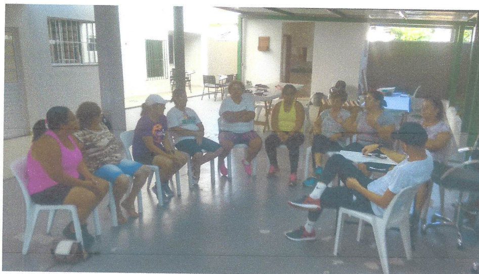
Palestra Equipe do CRAS

Rua Prof.ª Magdalena Sanseverino Grosso, 850 – Jd. Rezek II - Artur Nogueira - SP - CEP 13160-144 CNPJ 15.355.260/0001-57 Fone/Fax (19) 3877-9025 E-mail: susana.machuca@ucb.org.br Site: http://adra.org.br/transparencia/