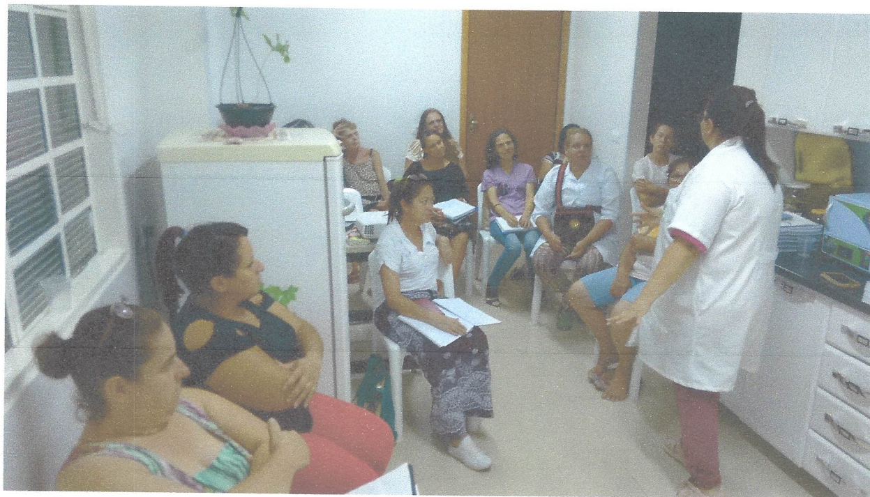
Oficina de Cuidador Idoso

Rua Prof. a Magdalena Sanseverino Grosso, 850 – Jd. Rezek II - Artur Nogueira - SP - CEP 13160-144 CNPJ 15.355.260/0001-57 Fone/Fax (19) 3877-9025 E-mail: susana.machuca@ucb.org.br Site: http://adra.org.br/transparencia/