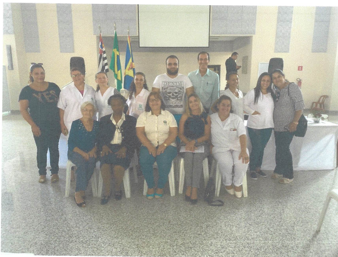
1ª Conferência Municipal do Idoso de Artur Nogueira